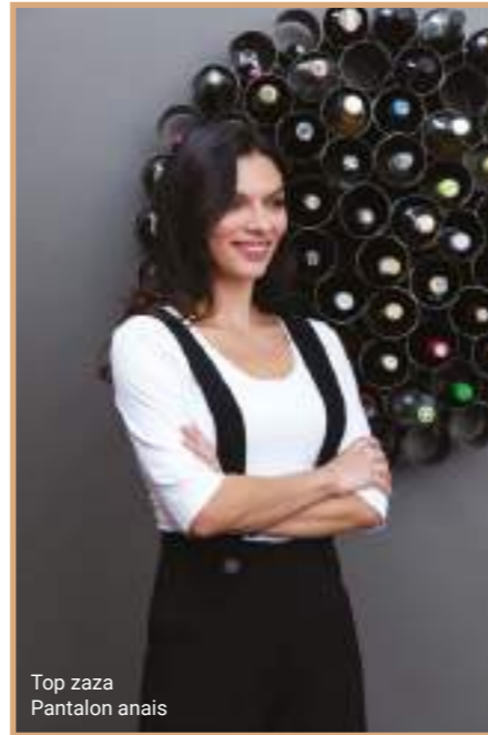
Top zaza Pantalon anais