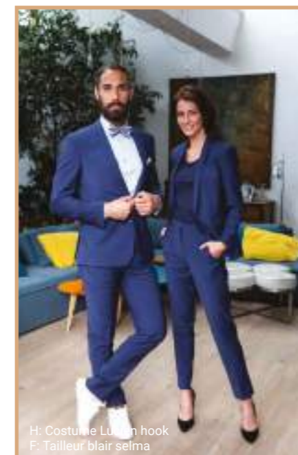
H: Costume Lucien hook F: Tailleur blair selma