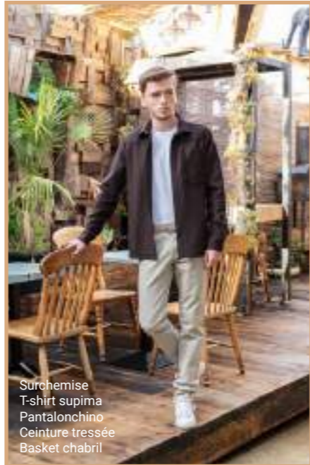
Surchemise T-shirt supima Pantalonchino Ceinture tréssée Basket chabril