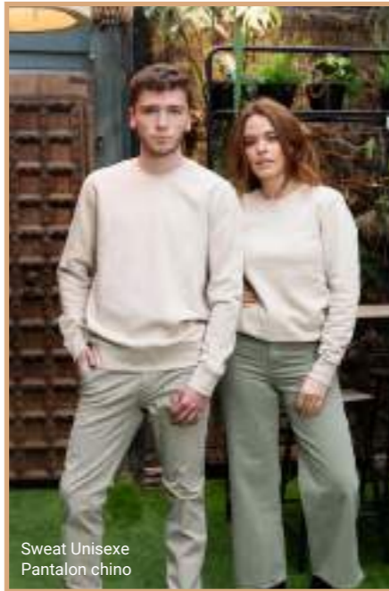
Sweat Unisex Pantalon chino