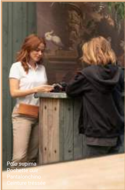
Polo supima Pochette cuir Pantalonchino Ceinture tréssée