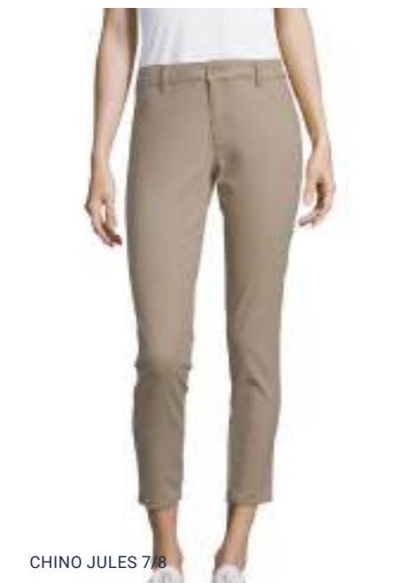
CHINO JULES 7/8