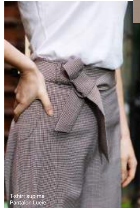
T-shirt supima Pantalon Lucie