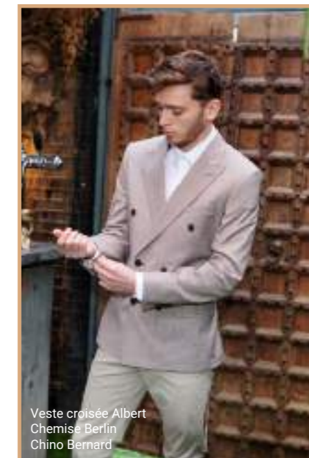
Veste croisée Albert Chemise Berlin Chino Bernard