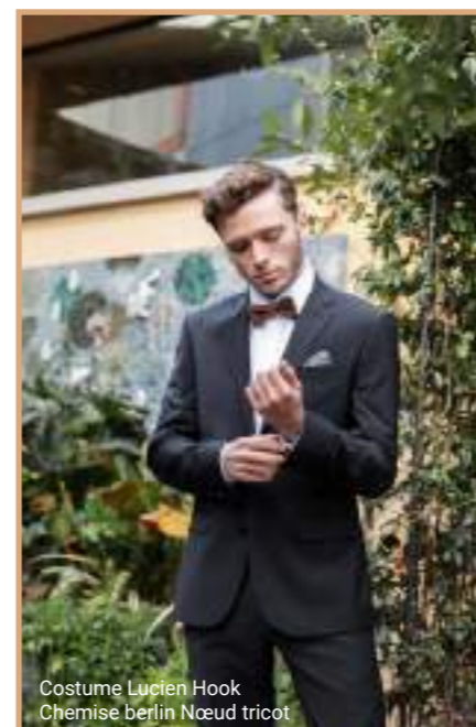
Costume Lucien Hook Chemise berlin Nœud tricot