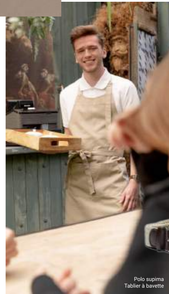
Polo supima Tablier à bavette