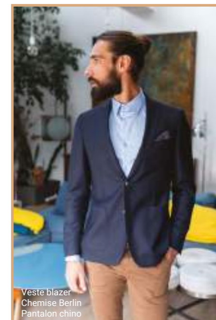
Veste blazer Chemise Berlin Pantalon chino