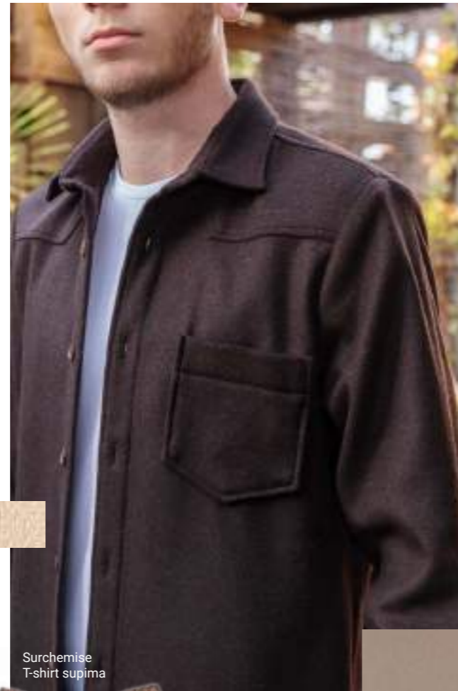
Surchemise T-shirt supima