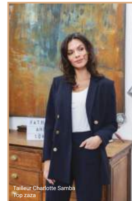
Tailleur Charlotte Samba Top zaza