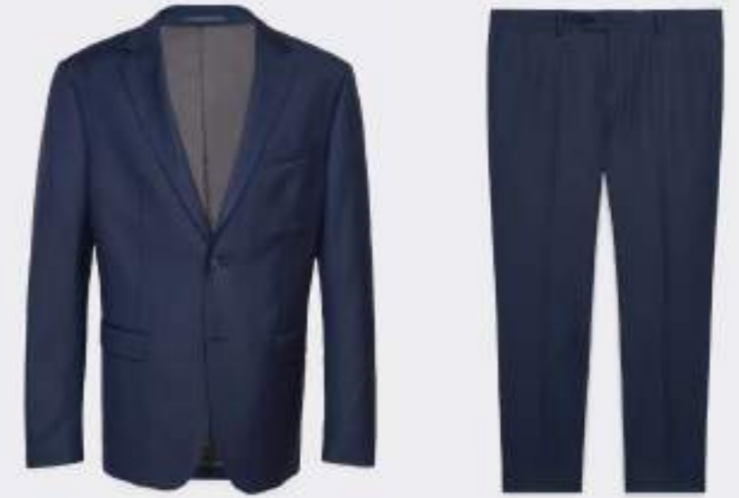
COSTUME & GILET VITALE