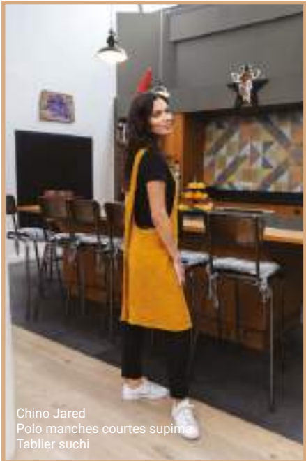
Chino Jared Polo manches courtes supima Tablier suchi