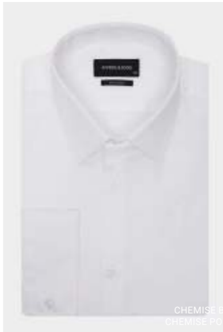
CHEMISE BERLIN (SLIM) CHEMISE POKER (REGULAR)