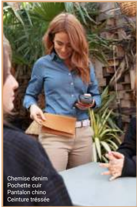
Chemise denim Pochette cuir Pantalon chino Ceinture tréssée