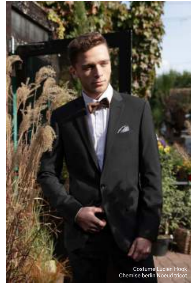
Costume Lucien Hook Chemise berlin Noeud tricot