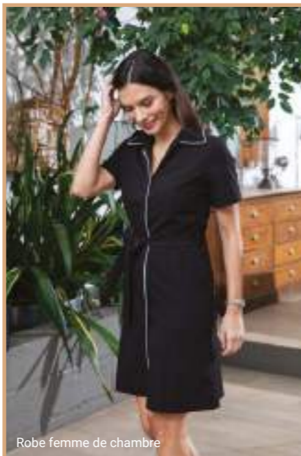
Robe femme de chambre